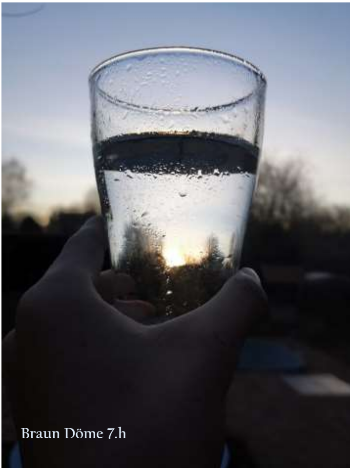
Braun Döme 7.h