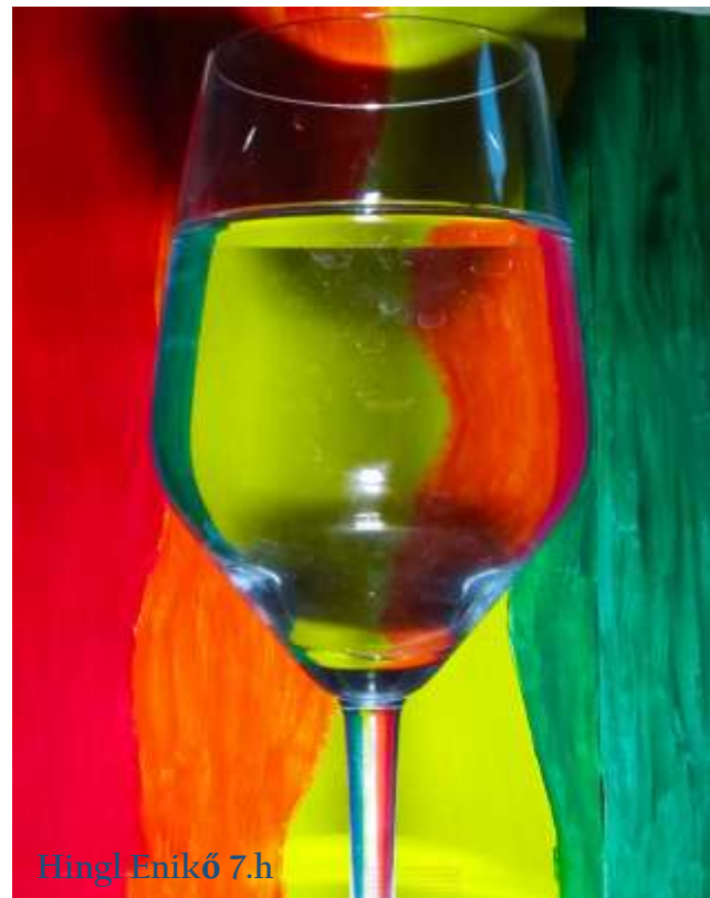
Hingl Enikő 7.h