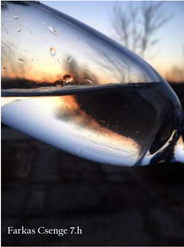
Farkas Csenge 7.h