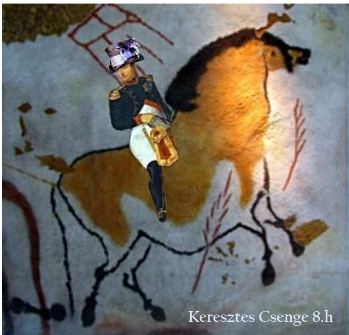
Keresztes Csenge 8.h