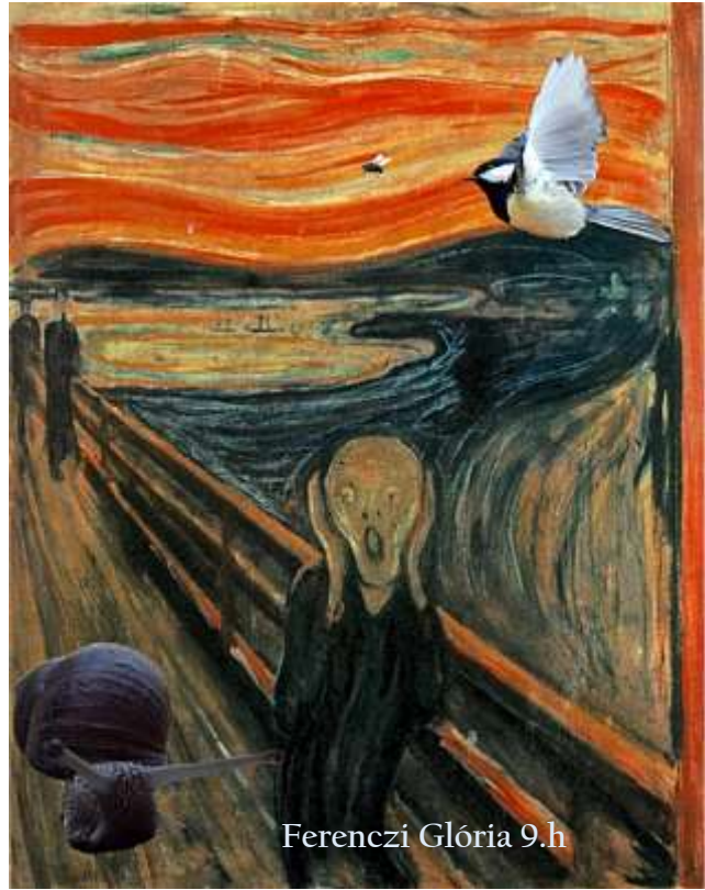
Ferenczi Glória 9.h