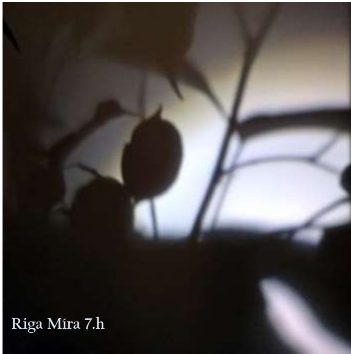
Riga Míra 7.h